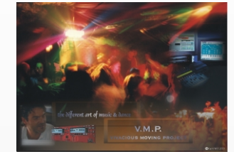
Die Meinung des Profis: DJ -V.M.P.

Mp3 revolutioniert das mobile Djing und alle Bereiche der Gastronomie in denen Musik von CD oder Vinyl gespielt wird. Future is now! < wb >