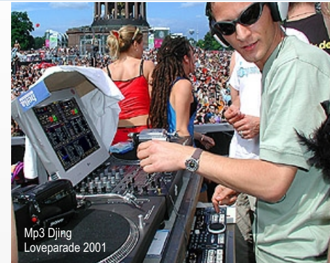
Mp3 Djing Loveparade 2001

Egal nach welchem Kriterium der Sound-Checker sucht, schon nach ein paar Anschlägen ist der gewünschte Song aus dem Riesenarchiv parat!